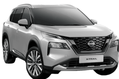
Ezüst K23 – 200 000 Ft