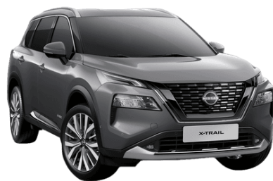
Szürke KAD – 200 000 Ft