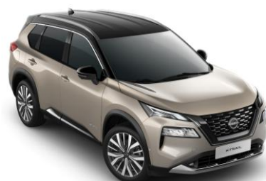
Pezsgőezüst - Fekete XEW – 420 000 Ft