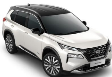
Gyöngyházfehér - Fekete XKJ – 420 000 Ft