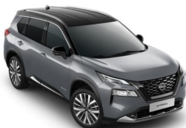
Gyöngyházzsürke - Fekete XEX – 420 000 Ft