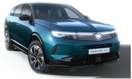
Spektrum zöld (metálfényezés)