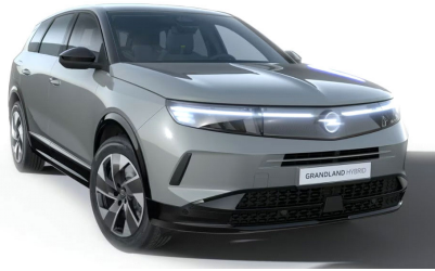
Grafik szürke (alapfényezés)