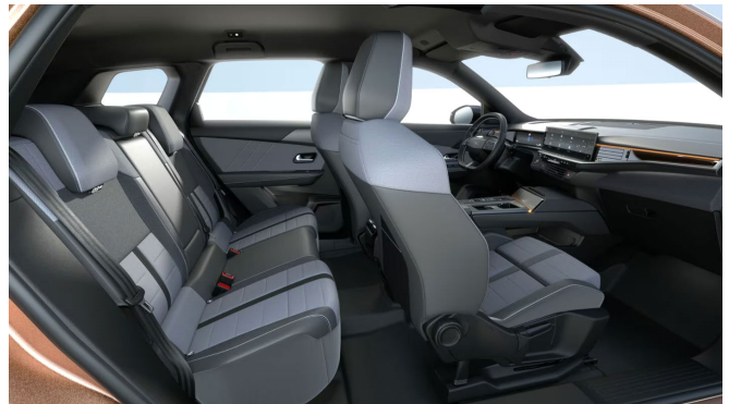
GS kárpit, szövet, sötétszürke/fekete (CBFT)