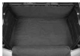
Csomagtartó burkolat (vinil lökhárító védelemmel)