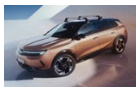
Keresztirányú tetőrudak hosszanti tetősínhez