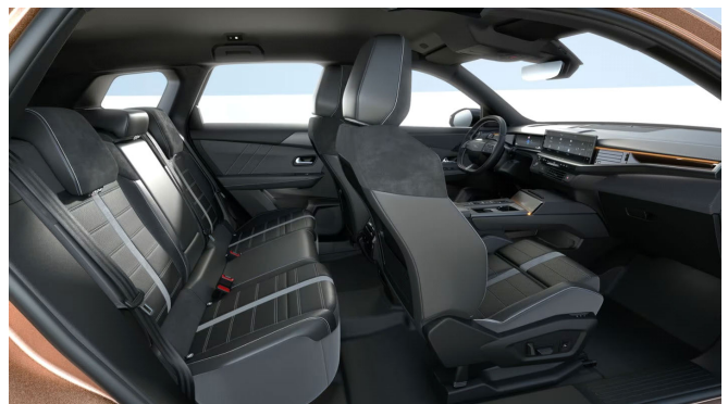
Bőrkárpit, perforált nappabőr, fekete (8BFC)