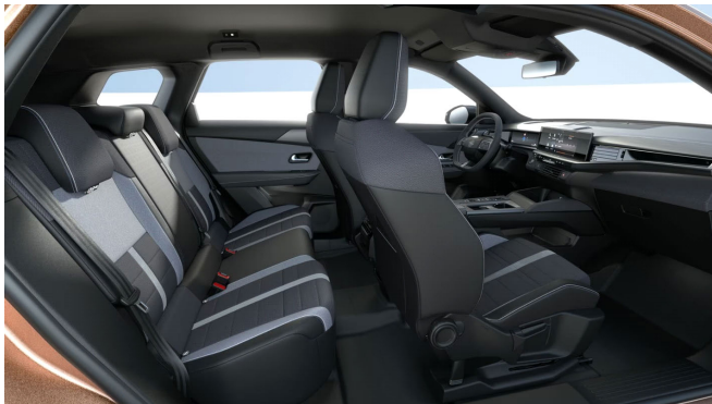
Édition kárpit, szövet, fekete/szürke (CBFR)