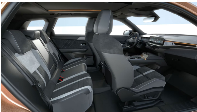
Alcantara kárpit (1UFX)