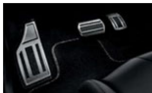
Alumínium pedálborítás, lábpihentetővel