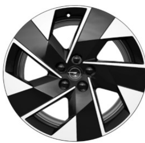
DZHL8 / DMI39