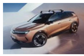
Keresztirányú tetőrudak hosszanti tetősínhez