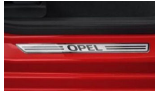
Első alumínium hatású Opel küszöbborítás