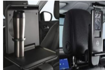
1 asztalka + 1 univerzális tablet tartó + 2 csatlakozó