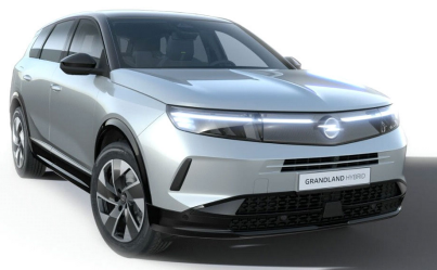
Kristall ezüst (metálfényezés)