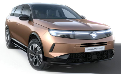
Impakt réz (metálfényezés)