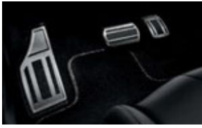
Alumínium pedálborítás, lábpihentetővel