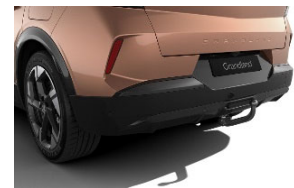
Szerszám nélkül leszerelhető vonóhorog 13 pólusú csatlakozóval