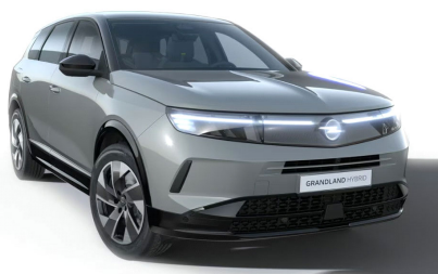
Grafik szürke (alapfényezés)