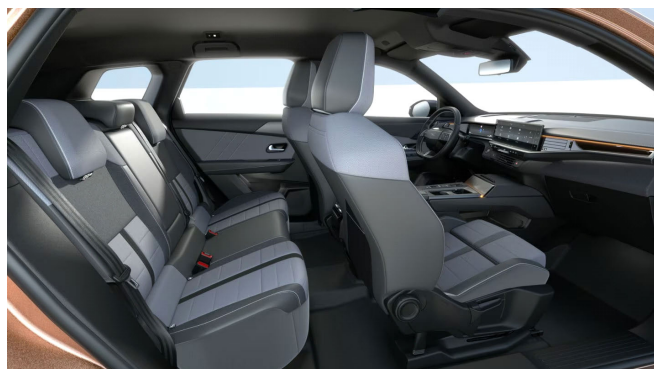
GS kárpit, szövet, sötétszürke/fekete (CBFT)