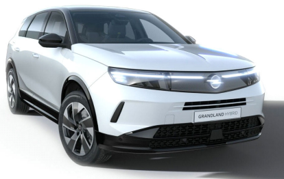
Arktis fehér (alapfényezés)