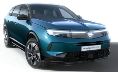
Spektrum zöld (metálfényezés)