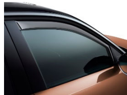
Légterelő első ajtóra, 2db-os szett