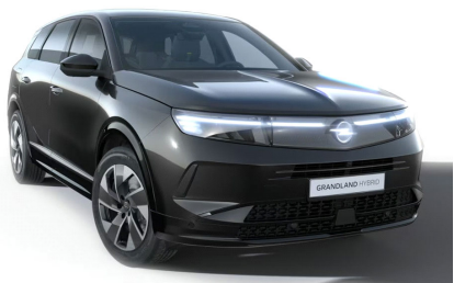
Karbon fekete (metálfényezés)