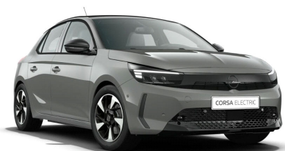
Grafik szürke (alapfényezés)