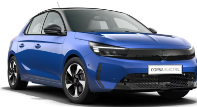
Voltaik kék (metálfényezés)