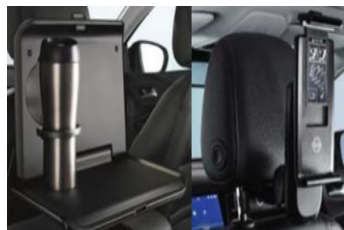
1 asztalka + 1 univerzális tablet tartó + 2 csatlakozó