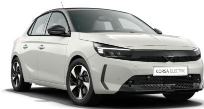
Arktis fehér (alapfényezés)