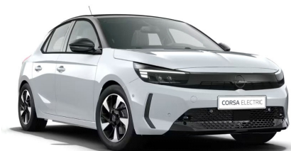
Kontur fehér (metálfényezés)