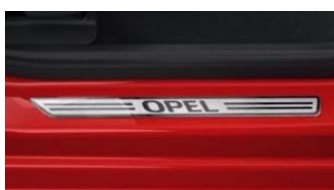
Első alumínium hatású Opel küszöbborítás