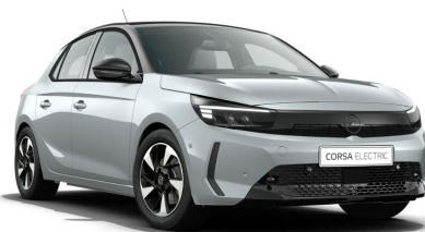
Kristall ezüst (metálfényezés)