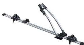
Freeride 532 1-db-os kerékpártartó