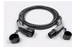
7,4 kW, 1 fázisú Type 2 kábel