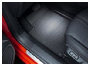
Négyévszakos szőnyeg garnitúra