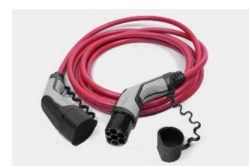
22 kW, 3 fázisú Type 2 kábel