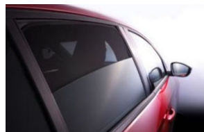
Hátsó és hátsó oldalsó árnyékoló szett