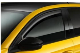
Szélterelő az első ablakokhoz