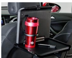
2 pohártartós asztalka 2 moduláris csatlakozó