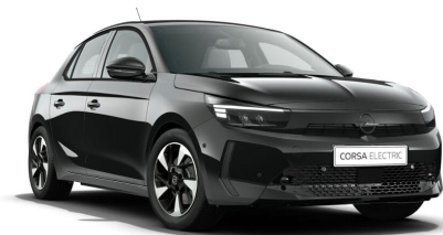
Karbon fekete (metálfényezés)