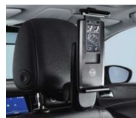
2 univerzális tablet tartó 2 moduláris csatlakozó