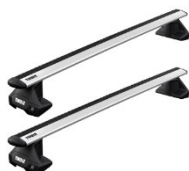
Corsa F-hez keresztirányú tetőrudak: