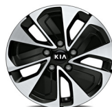
Könnnyűfém keréktárcsa 16" GOLD PLUS csomaghoz