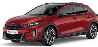
Magma Red (ARD) Prémium Metál