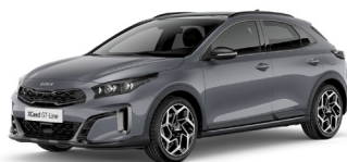
Lunar Silver (CSS) Metál