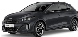
Penta Metal (H8G) Metál