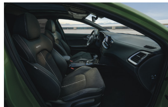
Opcionális BŐR csomag GT-Line felszereltséghez