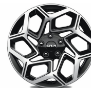
18" könnyűfém keréktárcsa (sztenderd GT-LINE felszereltséghez)