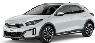
Deluxe White (HW2) Metál