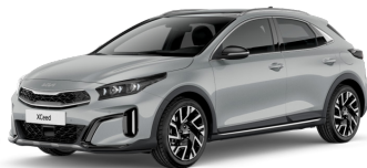
Wolf Grey (WAF) Prémium Metál csak Gold Sport-hoz elérhető