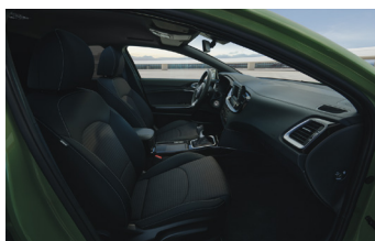
Textil kárpitozás ESSENCE felszereltségekhez