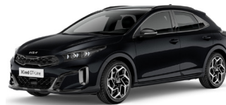
Black Pearl (1K) Metál