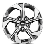
16" könnyűfém keréktárcsa (sztenderd ESSENCE, GOLD felszereltségekhez)