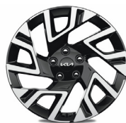
18" könnyűfém keréktárcsa (sztenderd GOLD SPORT, PLATINUM felszereltségekhez)