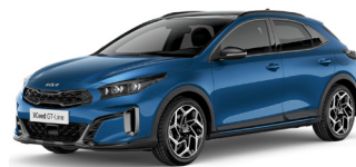
Blue Flame (B3L) Prémium Metál