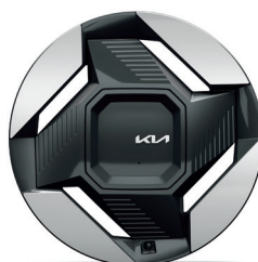
EARTH 19" keréktárca (YA) opció