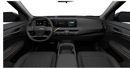
EARTH Vegán bőr és szövet ülésárpit (Bazalfekete)