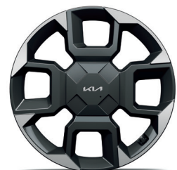
GT-LINE 19" keréktárca (YB)