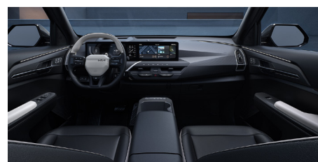
GT-LINE Vegán bőrlések (2Tone)