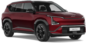
Magma Red (OVR) (Prémium metál)