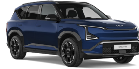
Dark Ocean Blue (BU3) (Prémium metál)