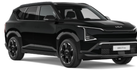
Fusion Black (FSB) (Metál)