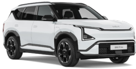
Snow White (SWP) (Metál)