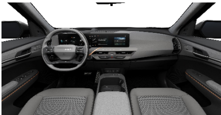
EARTH Vegán bőr és szövet ülésárpit (Törtszürke)