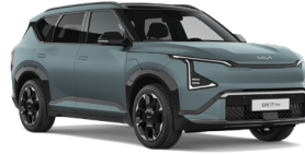
Iceberg Green (IEB) (Matt)