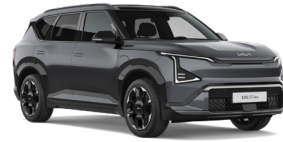
Gravity Grey (KDG) (Metál)