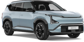
Frost Blue (EBB) (Alap szín)