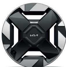
AIR / EARTH / LAUNCH EDITION 18" keréktárca (XX)