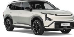
Ivory Silver (ISG) (Prémium metál)