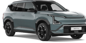
Iceberg Green (IEG) (Prémium metál)