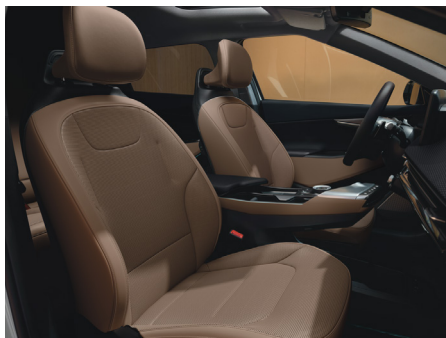
EARTH Vegánbőr ülésárpit (Lattebarna - CRJ)