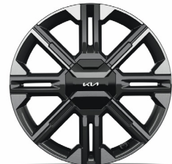
GT-LINE 20" keréktárcsa (VE) opció