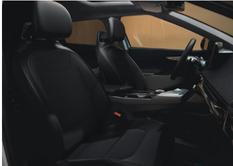
AIR Szövet / Vegánbőr ülésárpit (Bazaltfekete - WK)