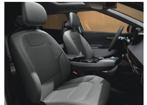
EARTH Vegánbőr ülésárpit (Törtszürke - DFS)