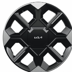
EARTH 20" keréktárcsa (UJ) opció