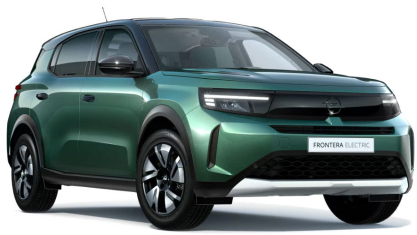
Terep zöld (metálfényezés)