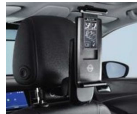
2 univerzális tablet tartó 2 moduláris csatlakozó