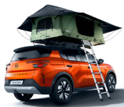
2 személyes tetősátor