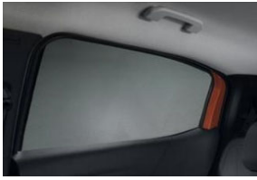
Sötétítő hátsó oldalsó ablakokra 2 db-os