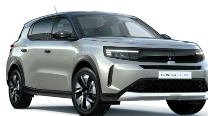
Kristall ezüst (metálfényezés)