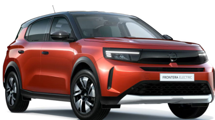
Kanyon narancs (metálfényezés)