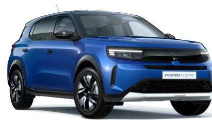
Effekt kék (metálfényezés)

(GS felszereltségen nem elérhető DJD02 Tető a karosszéria színében opcióval)