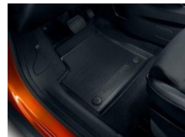
Gumiszőnyeg garnitúra első és hátsó