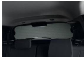
Sötétítő hátsó ablakra