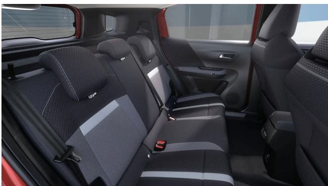
Gap kárpit, szövet, szürke/fekete (BMFR)