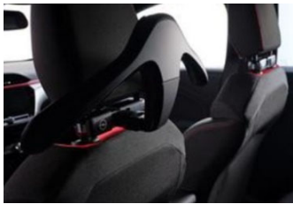
FlexConnect moduláris csatlakozó és vállfa