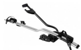
Expert 298 1-db-os kerékpártartó