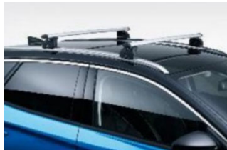
Keresztirányú tetőrudak hosszanti tetősínhez