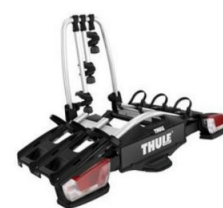
Coach 276 3 db-os bicikli tartó