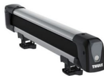
Snowpack 7324 tartó: 4 db síléc / 2 db snowboard