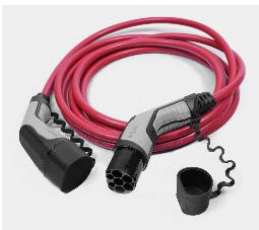
22 kW-os 3 fázisú 3x32A Type 2 kábel