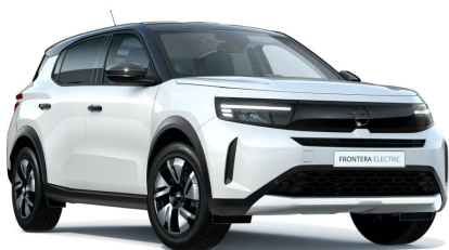
Arktis fehér (alapfényezés)