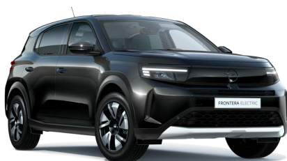
Karbon fekete (metálfényezés)