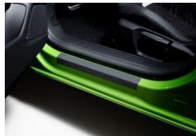
Küszöb védő borítás, 2db-os szett