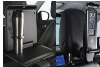
1 asztalka + 1 univerzális tablet tartó + 2 csatlakozó