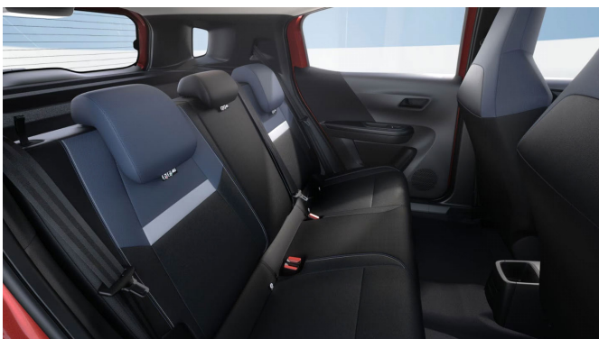
Riaz kárpit, szövet, kék/fekete/sötétszürke (BLFX)