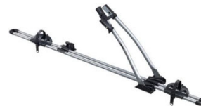
Freeride 532 1-db-os kerékpártartó