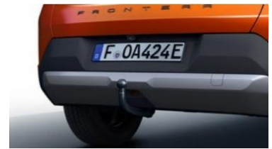
Szerszám nélkül leszerelhető vonóhorog (5 személyes kivitelhez, 17768 gyártástól)