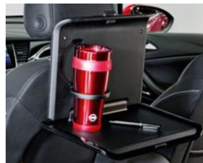
2 pohártartós asztalka 2 moduláris csatlakozó