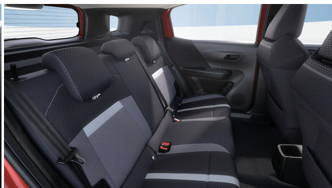
Gap kárpit, szövet, szürke/fekete (BMFR)