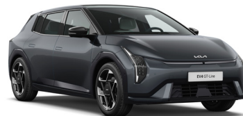
Penta Metal (H8G) Metál