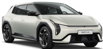
Ivory Silver (IS4) Matt