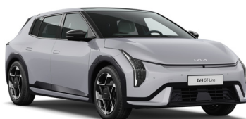
Wolf Grey (WAF) Prémium metál