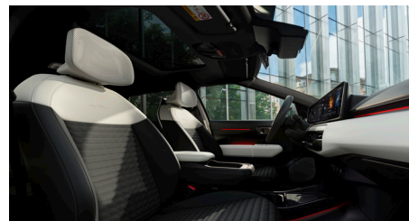
GT-LINE Vegán bőrlülések