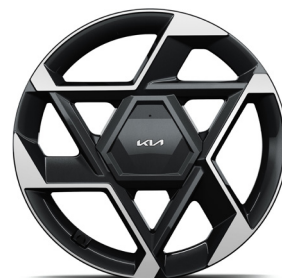
19" könnyűfém keréktárcsa (XP) GT-Line