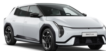
Deluxe White (HW2) Metál