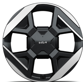
19" könnyűfém keréktárcsa (XM) Earth Plus opció