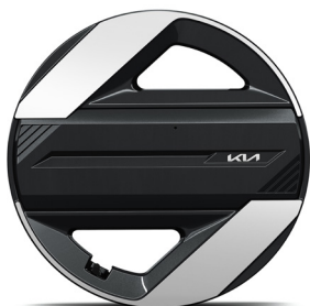
17" könnyűfém keréktárcsa (VA) Air / Earth / Earth Plus