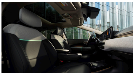
EARTH PLUS Fekete Vegán bőr szövet üléskárpit