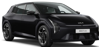
Pearl Black (1K) Metál