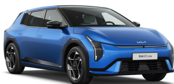
Blue Flame (B3L) Prémium metál