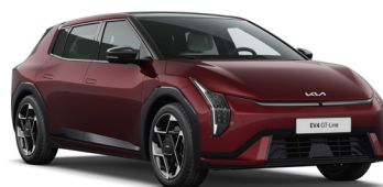
Magma Red (ARD) Prémium metál