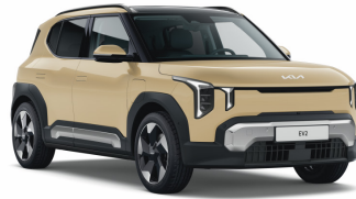
Vanilla Blossom (L3Y) Prémium Metál (GT-line-hoz nem elérhető)