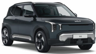
Penta Metál (H8G) Metál (alapszín GT-Line)