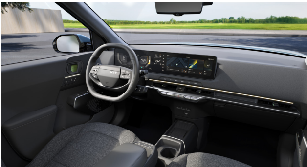
Air és Earth - Mélyszürke szövet ülésárpit (sztenderd)