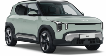
Morning Haze (DM8) Prémium metál