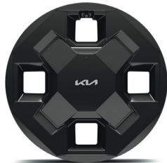
16" könnyűfém keréktácsa (MA) Air szterdend