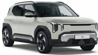
Ivory Silver Matte (IS4) Matt