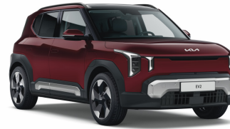
Magma Red (ARD) Prémium metál