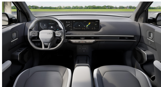
GT-Line - 2Tone vegan bőr ülésárpit (sztenderd)