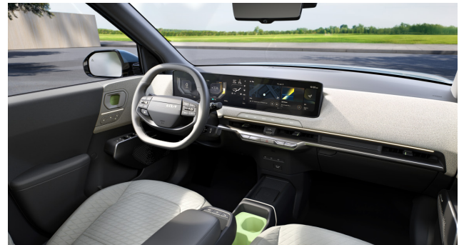
Earth - Mélyszürke + Vászónbész (CPB) szövet ülésárpit (opciós)