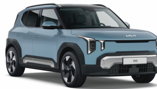
Frost Blue (EBU) Prémium metál