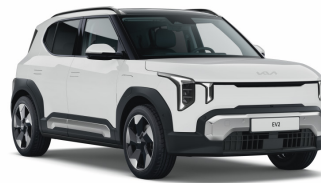
Cassa Wide (WD) Alapszín (GT-line-hoz nem elérhető)