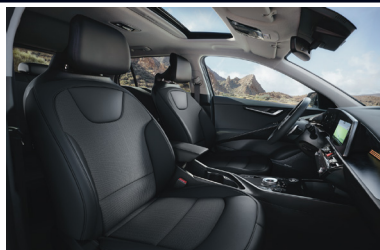
GOLD / PLATINUM fekete szintetikus bőr - szövet kárpit (sztenderd)