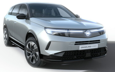
Kristall ezüst (metálfényezés)