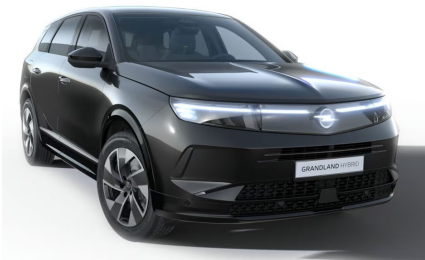
Karbon fekete (metálfényezés)