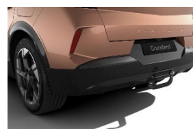
Szerszám nélkül leszerelhető vonóhorog 13 pólusú csatlakozóval