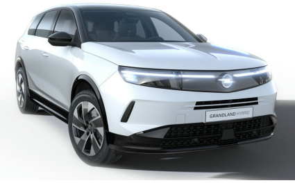
Arktis fehér (alapfényezés)