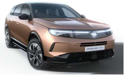
Impakt réz (metálfényezés)