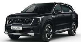
Aurora Black Pearl (ABP) METÁL