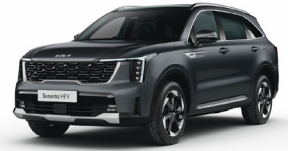
Interstellar Gray (AGT) PRÉMIUM METÁL