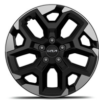
18" könnyűfém keréktárcsa (XK)