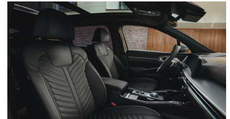
KRYPTONITE opcionális fekete Nappa bőr