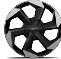
19" könnyűfém keréktárcsa (XM)