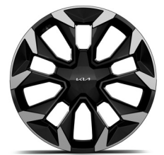
20" könnyűfém keréktárcsa (UV)