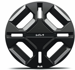
19" keréktárcsa (XP)