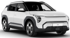
Clear White (UD) alapfényezés