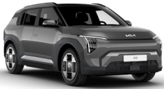
Shale Grey (EBD)