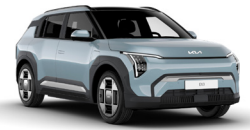
Frost Blue (EBB)