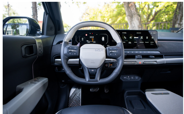
GT-LINE - sztenderd törtfehér-szürke vegán bőr üléskárpit - DFS