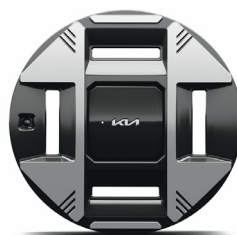
19" keréktárcsa (XM)