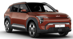
Terra Cotta (TCT)