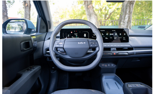
EARTH PLUS - sztenderd szürke 2tone vegán bőr üléskárpit - ELG (Blue díszbetéttel)