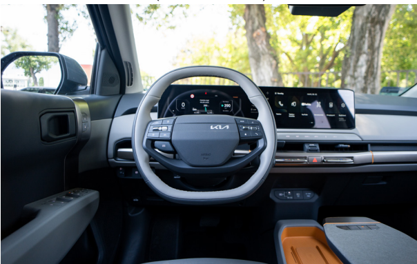
EARTH PLUS - opciós világos szürke 2tone vegán bőr üléskárpit - (Orange díszbetéttel) EWR