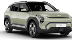
Aventurine Green (AG3)