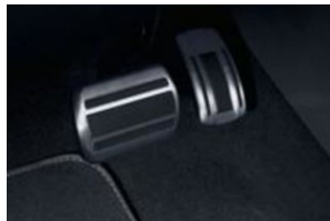
Rozsdamentes acél pedálborítás: 2 pedál (automata)