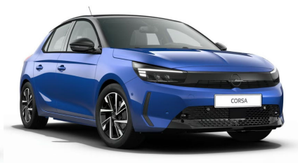
Voltaik kék (metálfényezés)