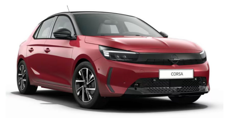
Kardio vörös (metálfényezés)