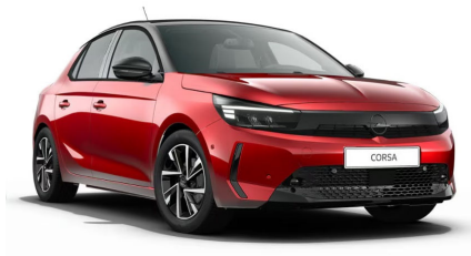
Vágyvörös (limitált metálfényezés)