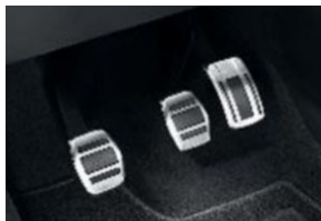
Rozsdamentes acél pedálborítás: 3 pedál (kézi)