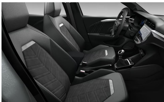
Guilford kárpit, bőrhatású / velúr, fekete (F4FX)