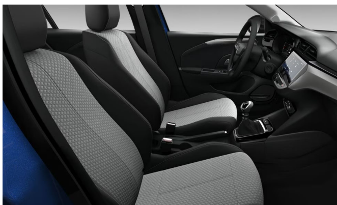
Freze kárpit, szövet, fekete (BPFX)