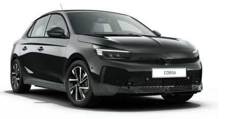
Karbon fekete (metálfényezés)