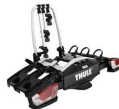
Coach 276 3 db-os bicikli tartó