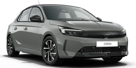
Grafik szürke (alulfényezés)