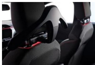
FlexConnect moduláris csatlakozó és vállfa