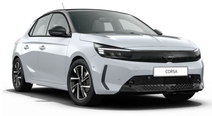
Kontur fehér (metálfényezés)