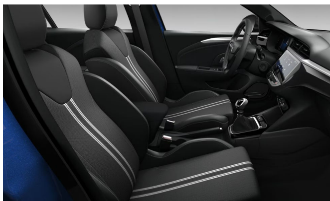
Banda kárpit, szövet, fekete és fehér (D4FV)