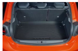
Csúszásgátló csomagterétlca megemelt szegéllyel