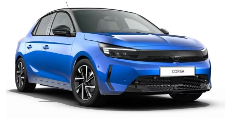
Hűségkék (limitált metálfényezés)