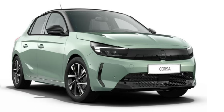
Reményzöld (limitált metálfényezés)