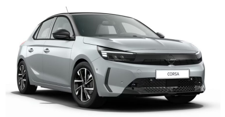
Kristall ezüst (metálfényezés)